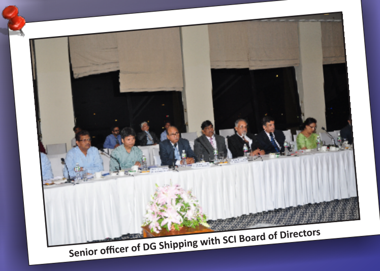
Senior officer of DG Shipping with SCI Board of Directors