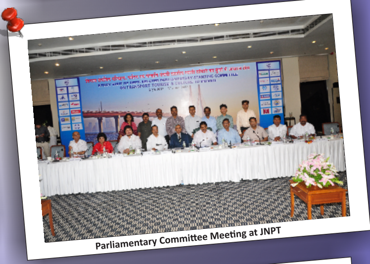
Parliamentary Committee Meeting at JNPT