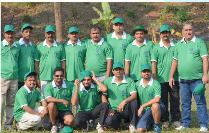
WINNERS- TEAM P & A