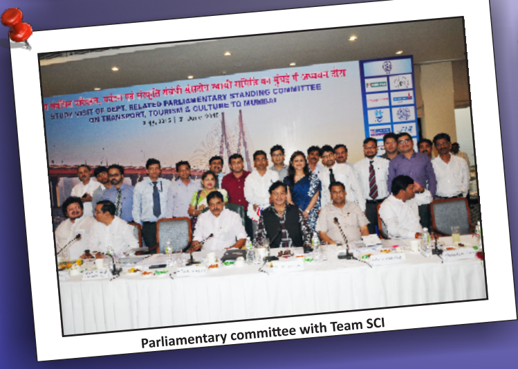
Parliamentary committee with Team SCI