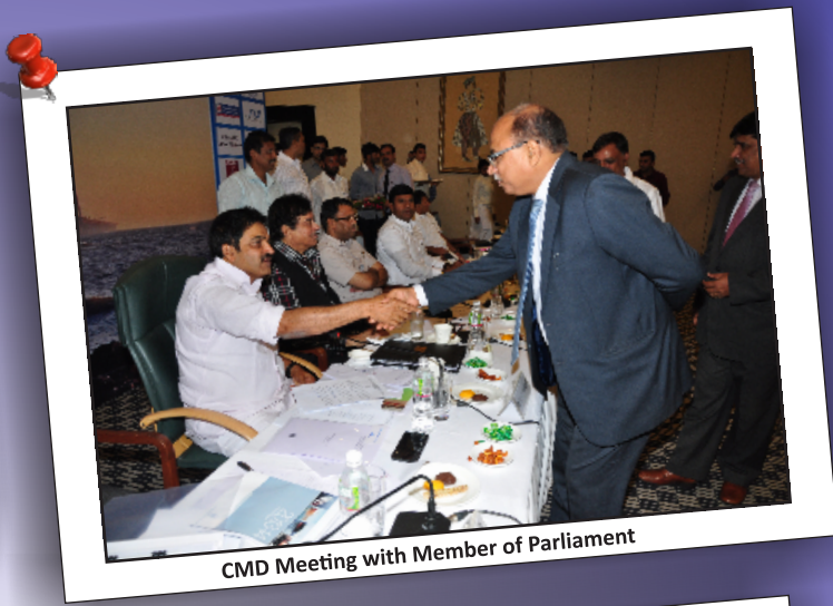
CMD Meeting with Member of Parliament