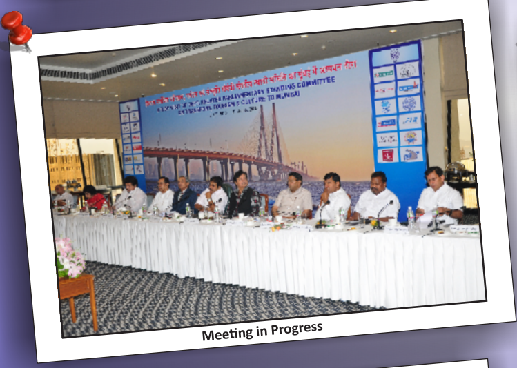
Meeting in Progress