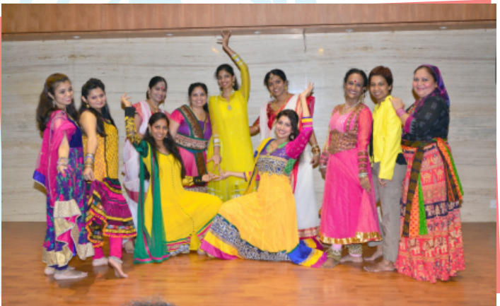
A skit and cultural activity presented by SCI lady employees.