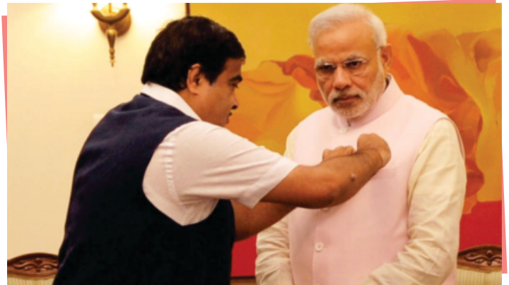
Shri Narendra Modi, Hon'ble Prime Minister of India accepting the NMD Flag from Shri Nitin Gadkari, Hon'ble Minister of Shipping

Shri Narendra Modi, Hon'ble Prime Minister of India, Shri Nitin Gadkari, Minister of Shipping and Shri Pon Radhakrishnan, Minister of State for Shipping, at PM's residence in New Delhi on 30th March 2015 on the occasion of NMD Flag pinning and Inauguration of the National Merchant Navy Week Celebrations 2015. The event was also attended by Shri Rajive Kumar, Secretary (Shipping), Shri Alok Srivastava, Additional Secretary (Shipping) and Shri Deepak Shetty, D.G. Shipping.