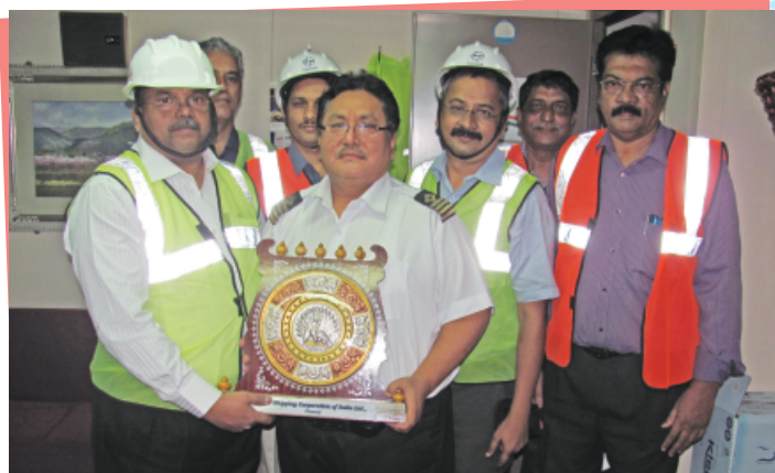
Kattupalli Port welcoming SCI's SMILE Service

Currently it will be a monthly service, which will be extended to a fortnightly service. This will create a Direct coastal cargoes from Gujarat to Vizag and Kattupalli (Tamil Nadu), Augmentation of coastal capacity for cotton trade between Gujarat and Tamil Nadu with addition of Kattupalli port. Direct shipment of cargoes from ECI to Persian Gulf without transshipment. Feeder service Vizag - Colombo currently dominated by foreign feeders. SCI is also working closely to include direct calls at Chittagong.