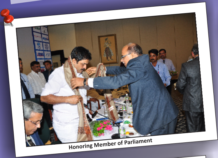
Honoring Member of Parliament