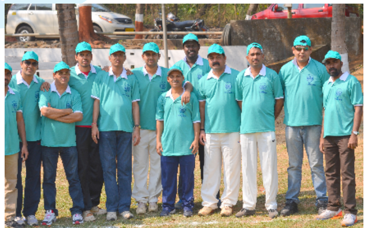
RUNNERS UP- TEAM T&OS